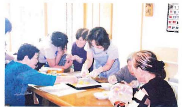
お土産にと前日、皆でクッキーを作りました。